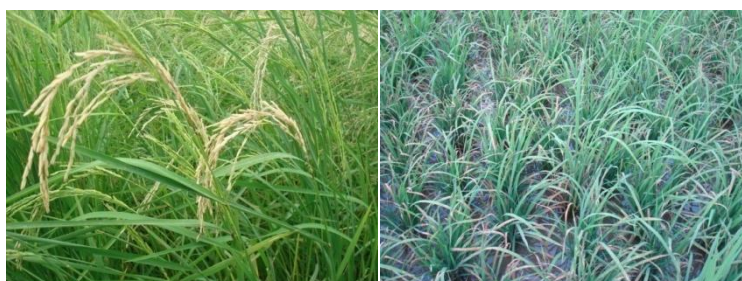
شکل ۵: علایم بلاست گردن خوشه