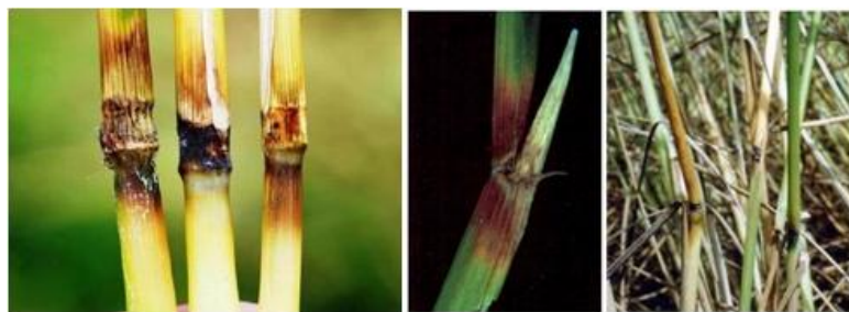
شکل ۷. آلودگی بندهای ساقه برنج