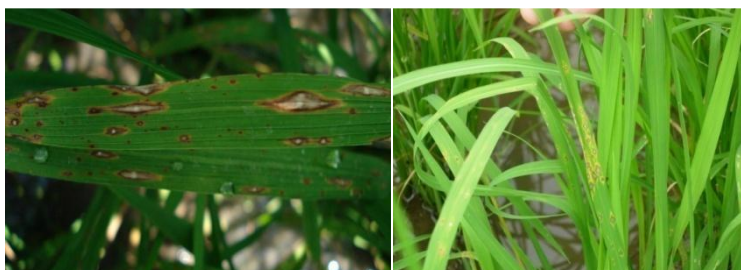
شکل ۳: علایم بلاست