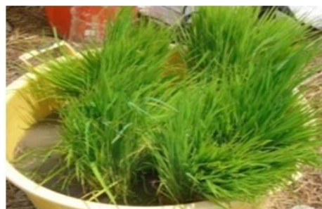
شکل ۱۰. غوطه‌ور کردن نشاء در محلول قارچ‌کش کارپروپامید