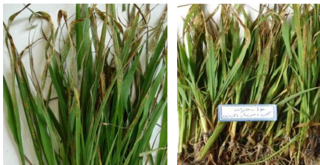
شکل ۱: علایم خسارت بلاست روی نشا در خزانه (عکس از نگارندگان)