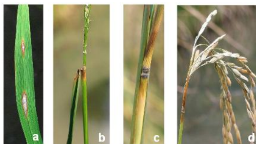
شکل ۸. ضایعات بلاست در برگ (a)، یقه (b)، گره (c) و گردن (d)