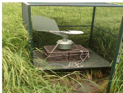
شکل ۹. دستگاه اسپورتراپ